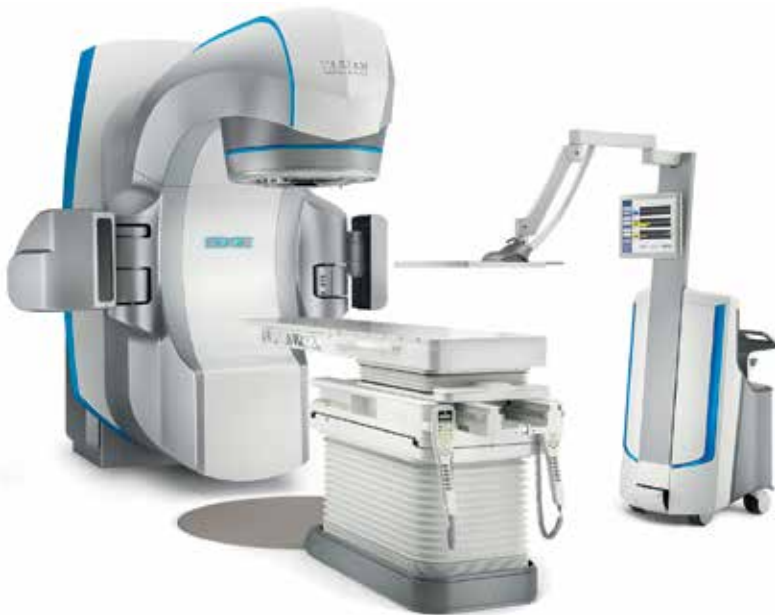
Genauere Bestrahlung entscheidend: der Linearbeschleuniger wird in der Krebsbekämpfung zur punktgenauen Bestrahlung des Tumorgewebes eingesetzt.